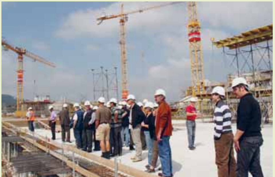
Auf dem Fussballplatz – Arenabaustelle St. Gallen.

Der Vorstand des KMU Region Hinterthurgau engagiert sich dahin, dass der Verein nah an der Basis ist. So ist das Ziel aus jeder Gemeinde im Südthurgau einen Vertreter im KMU Region HTG Vorstand zu haben. Dieser ist dann für die jeweilige Gemeinde Ansprechpartner in KMU-Fragen. Auf der Bezirkstufe ist es der KMU Region HTG, der Ansprechpartner für regionale Fragen politischer, wirtschaftlicher und gesellschaftlicher