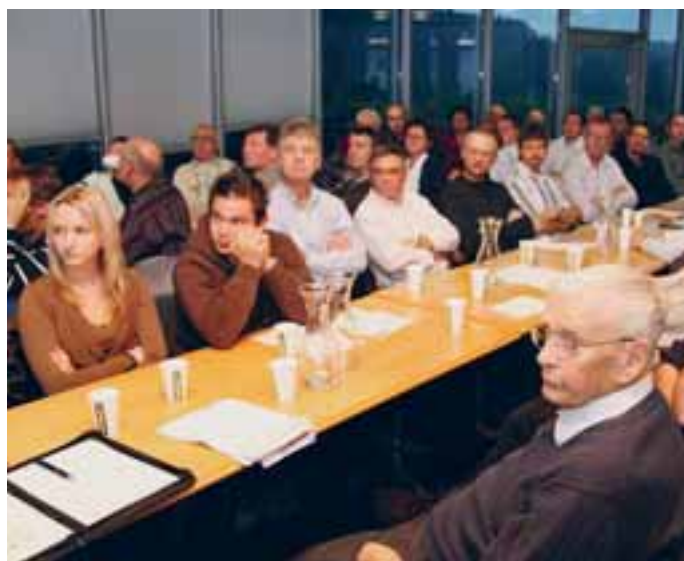
Blick in die Herbst-GV.